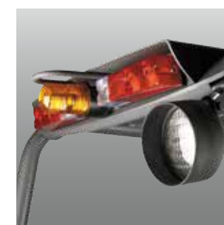
Luz de Trabajo Posterior