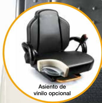
Asiento de vinilo opcional