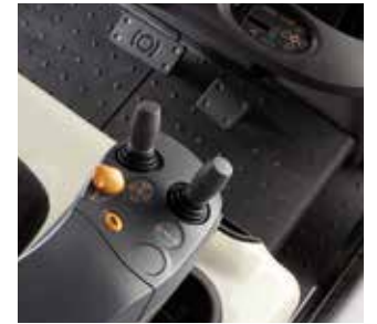
Palancas de Control de Doble Axis