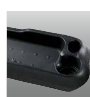
Bandeja de Almacenamiento

Desde distribución a fabricación el SC 5200 es muy flexible, productivo y proporciona ahorros a largo plazo. Conozca los de los resultados excepcionales que proporciona este equipo.