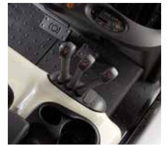
Palancas de Control Hidráulico