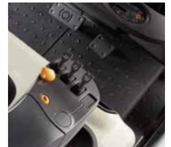
Palancas de Control Dactilar