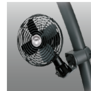
Ventilador del Operador