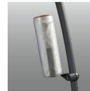
Sujetador para la Envoltura de Plástico