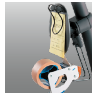
Porta Libretas y Gancho