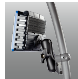
Sujeción de Montaje WMS