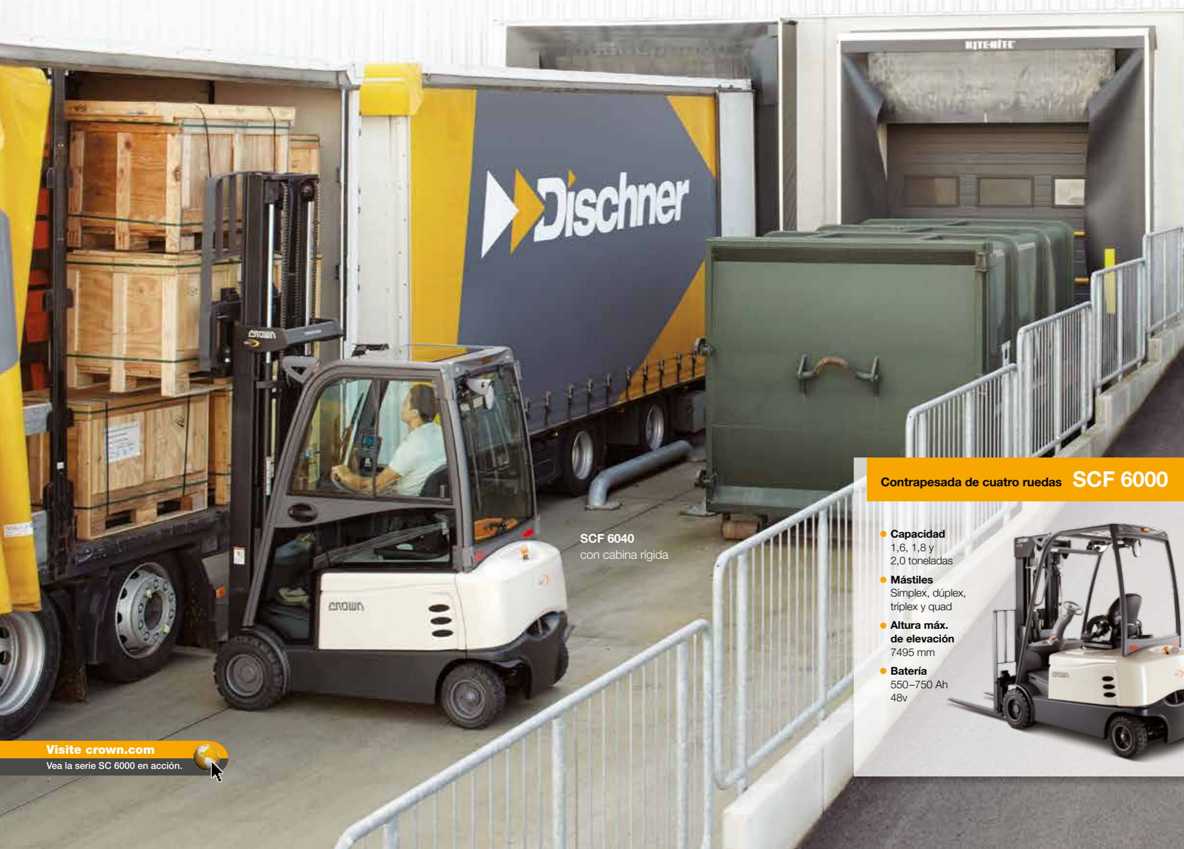
SCF 6040 con cabina rígida

estabilidad y maniobrabilidad. Si lo desea, puede personalizar aún más su montacargas con múltiples opciones de controles hidráulicos, luces, accesorios, etcétera.