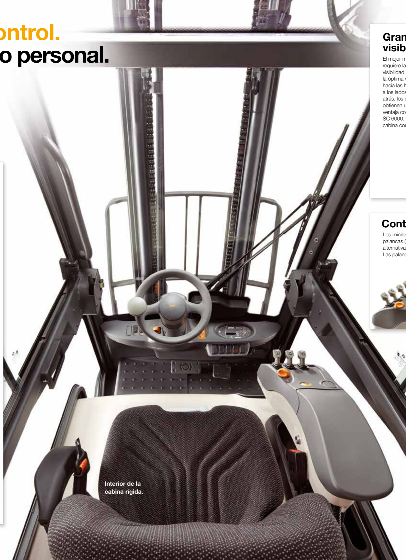
Interior de la cabina rígida.