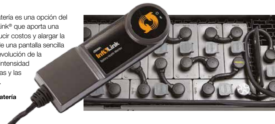
Controlador del estado de la batería

El controlador del estado de la batería es una opción del sistema de gestión de flotas InfoLink® que aporta una información muy valiosa para reducir costos y alargar la vida útil de las baterías. A través de una pantalla sencilla e intuitiva, se puede consultar la evolución de la batería, el historial de cargas y la intensidad de corriente, las cargas intermedias y las mediciones de agua/temperatura.