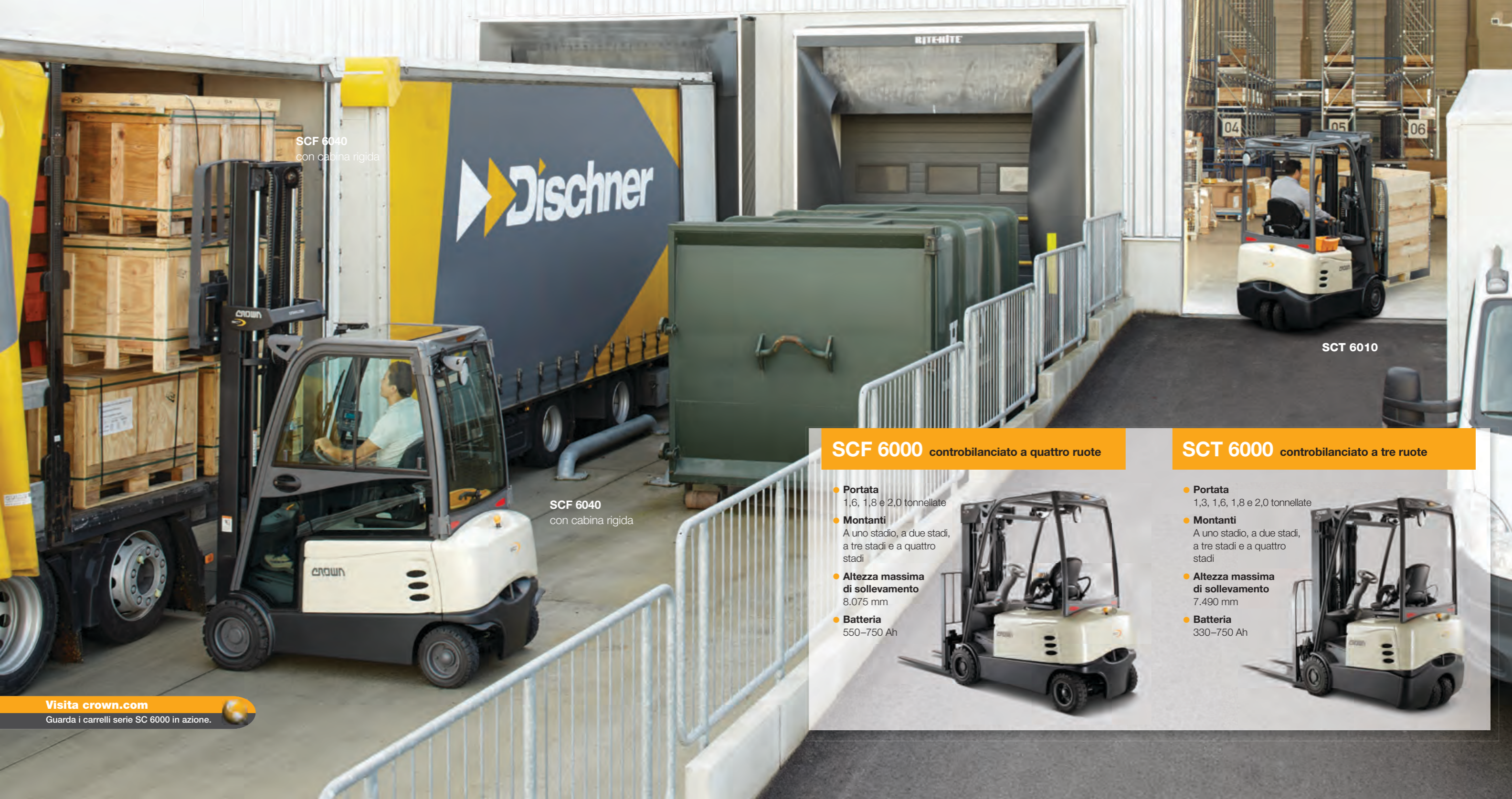
SCF 6040 con cabina rigida

e manovrabilità eccezionali. Per ottimizzare ulteriormente le prestazioni, Crown offre inoltre una gamma di optional tra comandi, luci, accessori e molto altro.