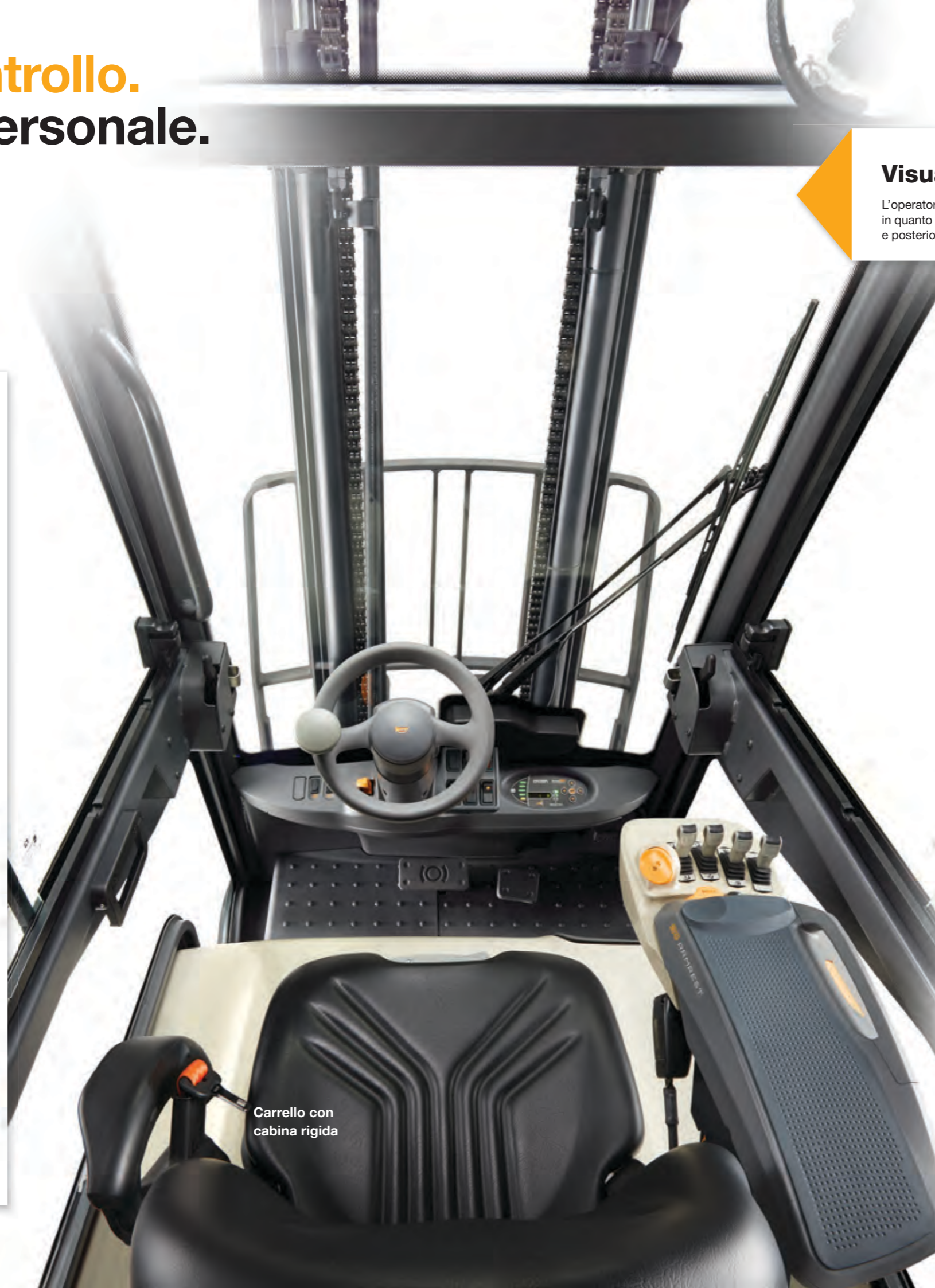
Carrello con cabina rigida