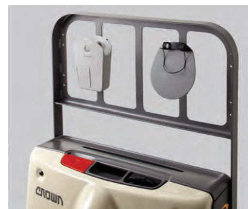
Griglia reggicarico con accessori Work Assist™

Il design del WP 3010 lo rende ideale per il trasporto su autocarri. Il carrello rientra perfettamente nello spazio che rimane in fondo all'autocarro carico o nei contenitori di stoccaggio sotto all'autocarro. Progettato per sopportare temperature comprese tra -15 e +40 °C, il WP 3010 può essere lasciato sull'autocarro per tutta la notte senza problemi. I lunghi intervalli di manutenzione e i requisiti di assistenza minimi ne consentono un utilizzo affidabile, ovunque.