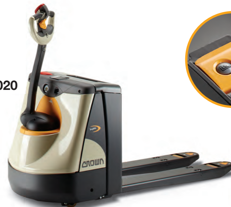
WP 3020 2000 kg

Il sistema di gestione del parco carrelli InfoLink® di Crown offre accesso online a dati vitali su operatori e carrelli.