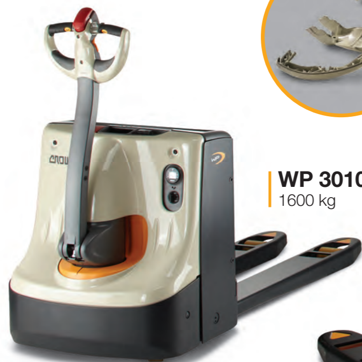
WP 3010 1600 kg

Il robusto timone X10® è realizzato con una lega di alluminio con processo di pressofusione sottovuoto, per una forza e resistenza eccezionali.