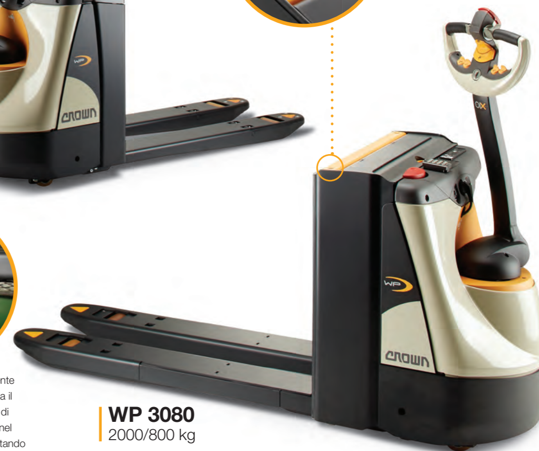
WP 3080 2000/800 kg

Il pulsante di sollevamento dislocato sulla copertura della batteria del WP 3080 fornisce un comodo accesso stando in piedi accanto al carico.