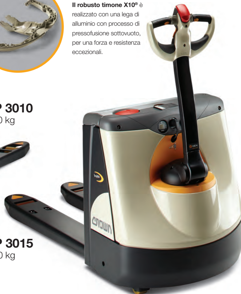
WP 3015 1600 kg