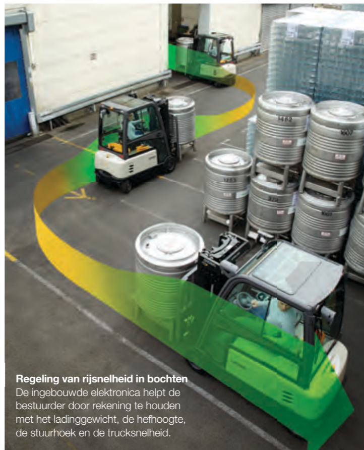
Regeling van rijsnelheid in bochten De ingebouwde elektronica helpt de bestuurder door rekening te houden met het ladinggewicht, de hefhoogte, de stuurhoek en de trucksnelheid.

Dit intelligente systeem maakt gebruik van geïntegreerde sensoren en controlepunten om de belangrijkste functies en bewegingen continu te bewaken en te regelen. Zo wordt de inherente technische stabiliteit van de truck gebruikt om de veiligheid en prestaties te optimaliseren. Onze hefmashtverhoging en -damping helpt de bestuurder ook om de bewegende lading altijd onder controle te houden.