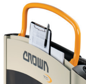
Extra opbergvak rugzijde

De TC 3000 Serie biedt met de innoverende en eenvoudig toepasbare Work Assist-accessoires de ideale oplossing voor elke werkomgeving. Work Assist-accessoires zoals opbergvakken, klemmborden, een vuilniszakhouder of bekerhouder kunnen eenvoudig worden aangebracht en gecombineerd. Het accessoire kan dankzij het universele bevestigingssysteem makkelijk worden bevestigd op het frame voor Work Assist-accessoires, dat met of zonder kabelmanagement verkrijgbaar is. U kunt ook laadplateaus (voor en achteraan), een rekfoliehouder, scanpistoolhouders en gegevensmonitoren toevoegen.