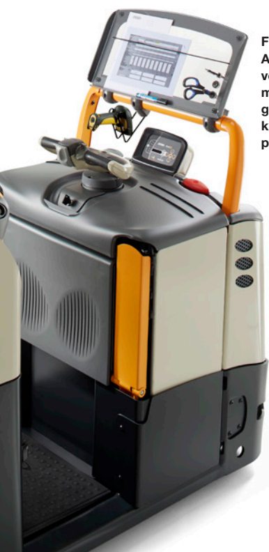
Frame voor Work Assist-accessoires voorop met kabelmanagement, groot transparant klembord en scanpistoolhouder

Met Crown's Work Assist-accessoires kunt u het perfecte mobiele werkstation voor uw eigen toepassing creëren.