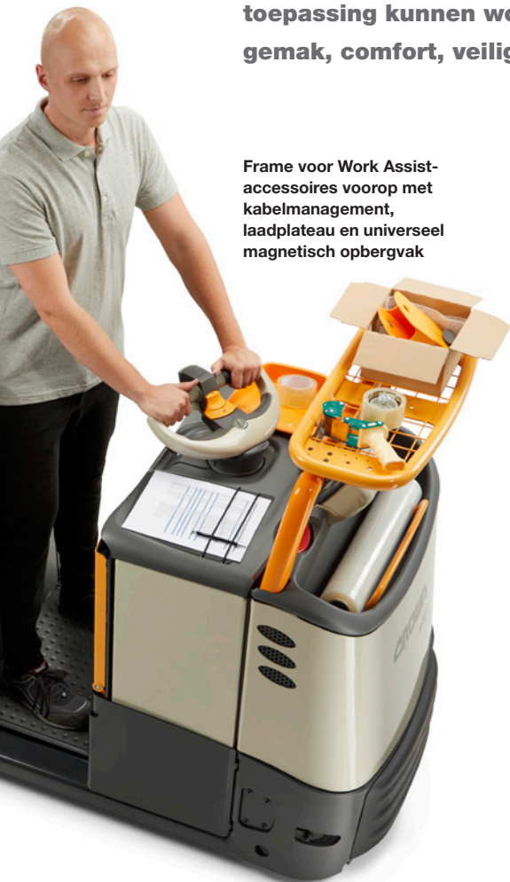
Frame voor Work Assist-accessoires voorop met kabelmanagement, laadplateau en universeel magnetisch opbergvak

Crown heeft na analyse van alle transport- en orderverzameltaken Work Assist-accessoires ontworpen die aan elke toepassing kunnen worden aangepast voor meer gebruiksgemak, comfort, veiligheid en productiviteit.