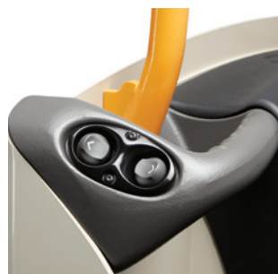
Hitch Position Control