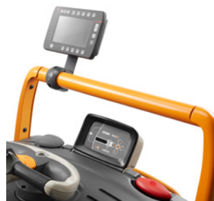
Frame voor Work Assist-accessoires voorop met kabelmanagement

Met Crown's Work Assist-accessoires kunt u het perfecte mobiele werkstation voor uw eigen toepassing creëren.