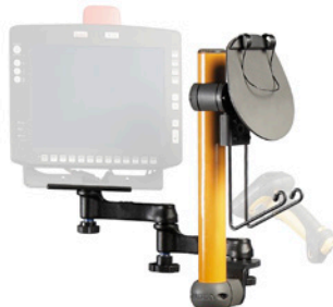
Frame voor Work Assist-accessoires achterop met klein klembord, scanpistoolhouder en universele houder met verstelbare zwenkarm voor WMS-monitors