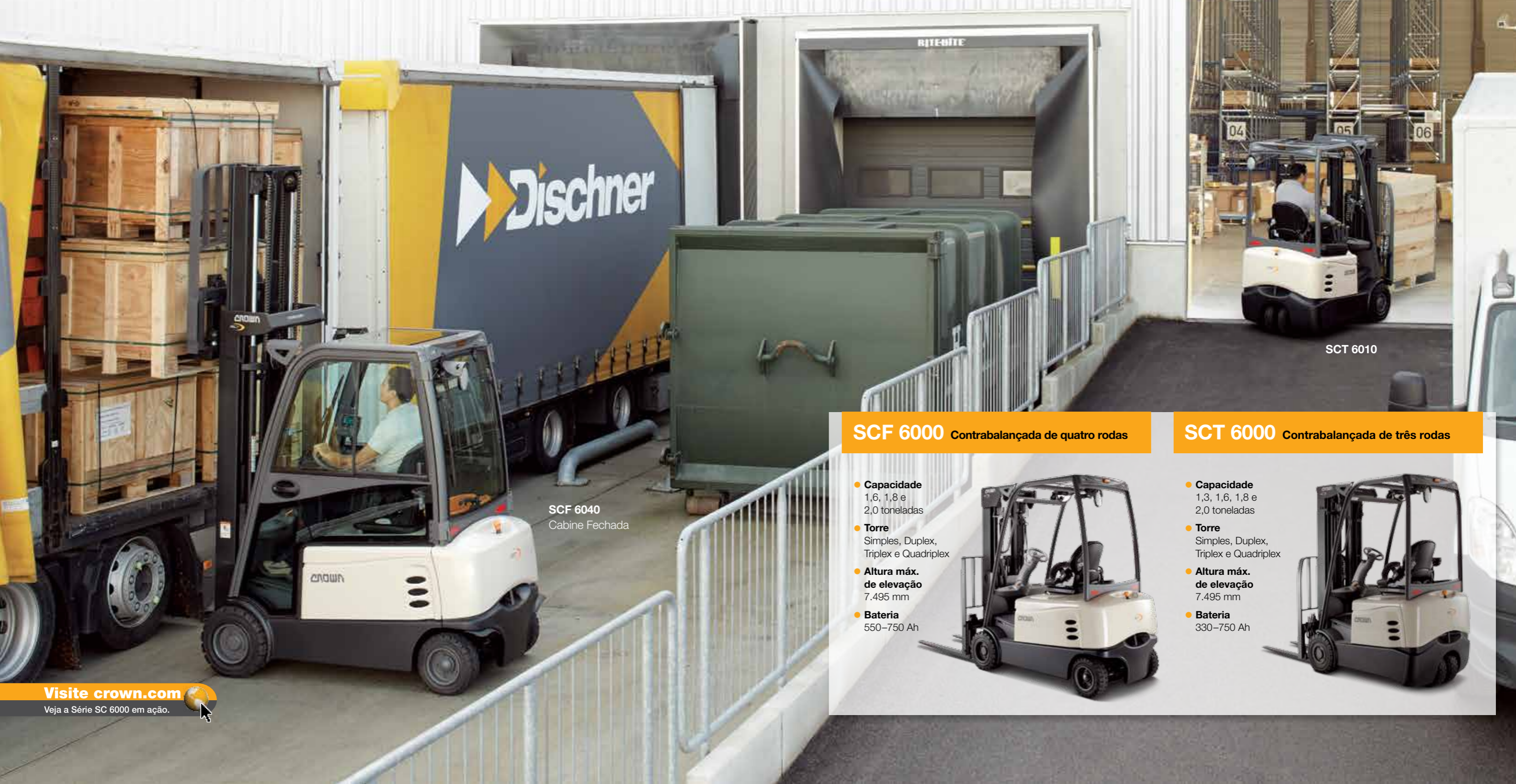
SCF 6040 Cabine Fechada

a você uma exclusiva vantagem em estabilidade e manobrabilidade. Otimize sua empilhadeira com opções de controle, iluminação, acessórios e muito mais.