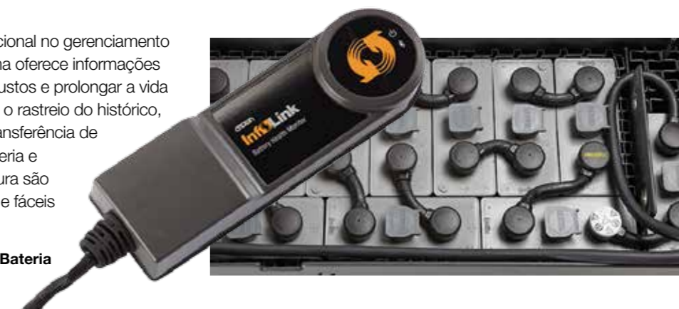
Monitor de Saúde da Bateria

O Battery Health Monitor é opcional no gerenciamento de frotas Infoblink™. Este sistema oferece informações valiosas que ajudarão a gerir custos e prolongar a vida útil da bateria. Recursos como o rastreamento do histórico, histórico de carga e taxa de transferência de corrente, enfileiramento de bateria e medições de água e temperatura são relatados em painéis concisos e fáceis de usar.