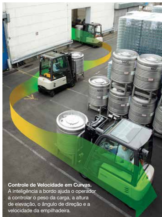
Controle de Velocidade em Curvas. A inteligência a bordo ajuda o operador a controlar o peso da carga, a altura de elevação, o ângulo de direção e a velocidade da empilhadeira.

O sistema inteligente usa os sensores integrados e os comandos para monitorar e controlar constantemente as principais funções e movimentos. Ele melhora a estabilidade projetada da empilhadeira para otimizar segurança e desempenho. Nosso sistema de posicionamento faseado e amortecimento do mastro em processo de patenteação também ajuda os operadores a manter o controle da carga em movimento em todos os momentos. Deste modo, a empilhadeira oferece segurança mesmo quando os operadores não estão pensando nisso.