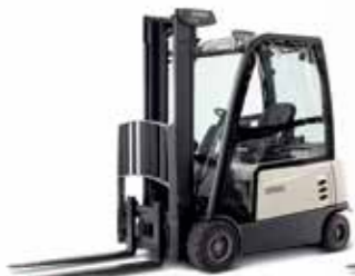
Cabine parcialmente fechada