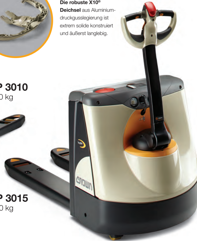
WP 3015 1600 kg