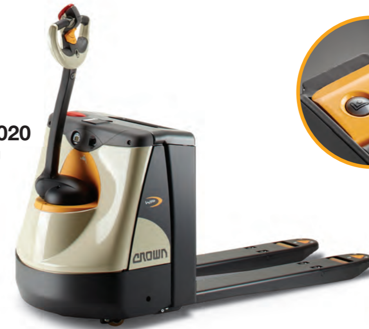
WP 3020 2000 kg