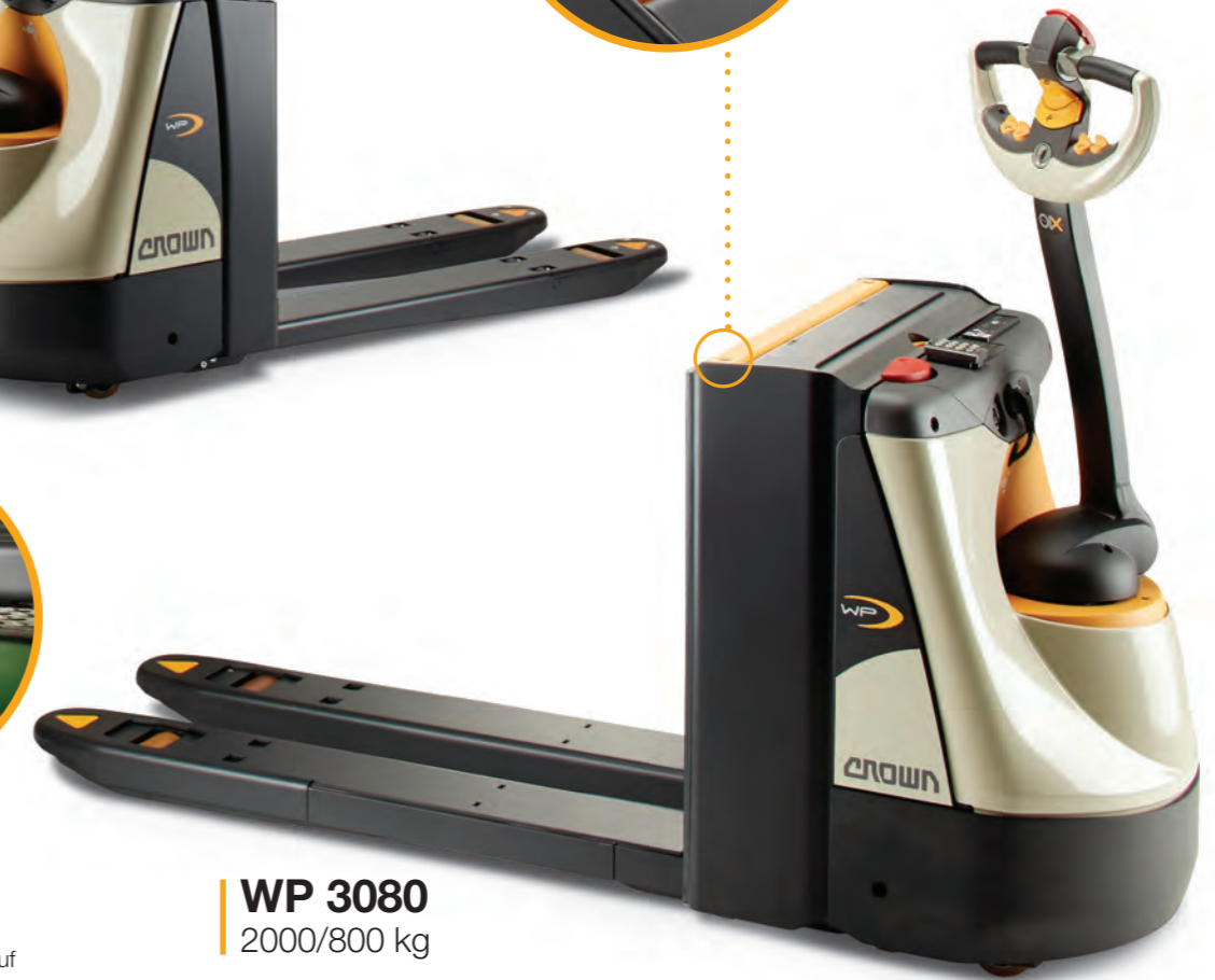
WP 3080 2000/800 kg

Das Hubgestänge mit Zugstange (nur für bestimmte Modelle) versetzt die Achsaufhängung an den höchstmöglichen Punkt, um auf unebenen Böden Schäden und Verschleiß vorzubeugen.