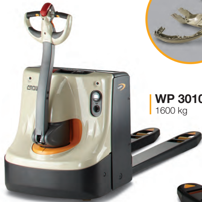
WP 3010 1600 kg

Die robuste X10® Deichsel aus Aluminium-druckgusslegierung ist extrem solide konstruiert und äußerst langlebig.