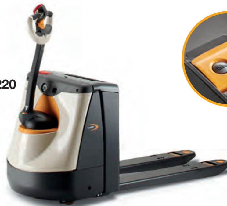
WP 3220 2000 kg

Plantéese cómo afectan las transpaletas a sus costes laborales, de mantenimiento y de reparaciones. El diseño duradero y enfocado hacia el operario de la serie WP 3200 le aporta un valor añadido. Tanto si sus requisitos de utilización son bajos, como si busca un producto de alto rendimiento que permita el funcionamiento en tres turnos, Crown tiene la solución perfecta para su empresa.