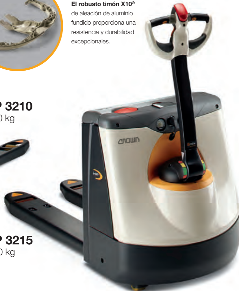
WP 3215 1600 kg

Plantéese cómo afectan las transpaletas a sus costes laborales, de mantenimiento y de reparaciones. El diseño duradero y enfocado hacia el operario de la serie WP 3200 le aporta un valor añadido. Tanto si sus requisitos de utilización son bajos, como si busca un producto de alto rendimiento que permita el funcionamiento en tres turnos, Crown tiene la solución perfecta para su empresa.