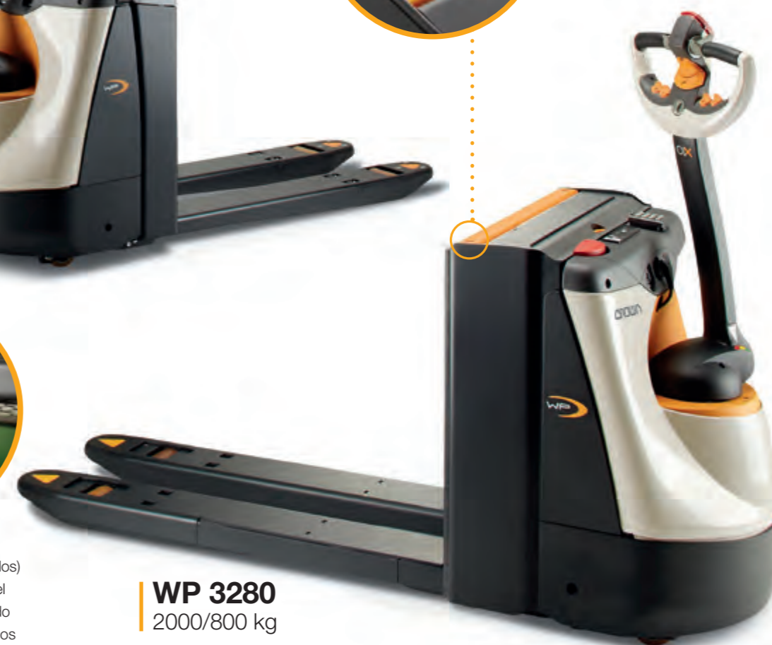
WP 3280 2000/800 kg

El sistema de elevación por «tirantes» (solo algunos modelos) coloca el eje de pivotación en el punto más alto posible, evitando así roturas y desgastes causados por suelos irregulares.