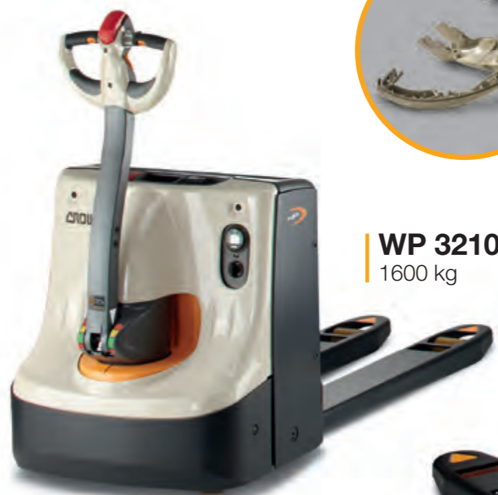
WP 3210 1600 kg

El robusto timón X10 ® de aleación de aluminio fundido proporciona una resistencia y durabilidad excepcionales.