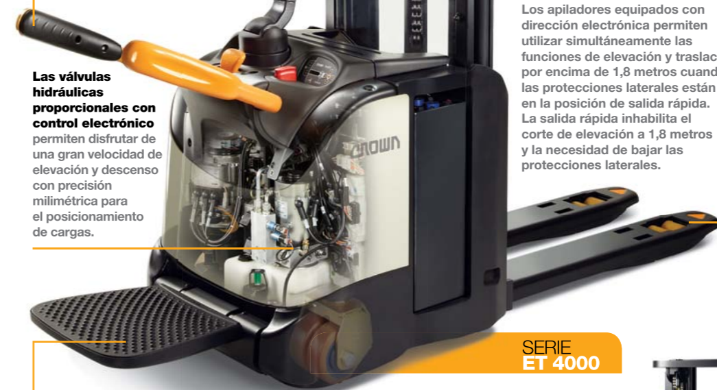
SERIE ET 4000

Las protecciones laterales con función de salida rápida se alcanzan fácilmente para que el operario pueda salir sin dificultad por el lateral de la máquina en lugares congestionados. Los apiladores con dirección mecánica automáticamente cortan la elevación a 1,8 metros, salvo que las protecciones laterales estén bajadas del todo.