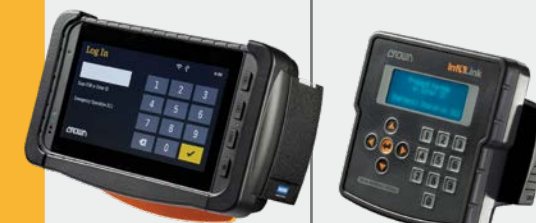
Écran tactile 7 po