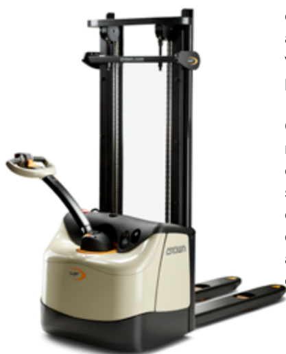
Serie WF 3200 1000 – 1200 kg