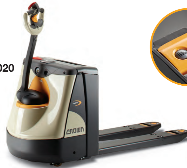
WP 3020 2000 kg