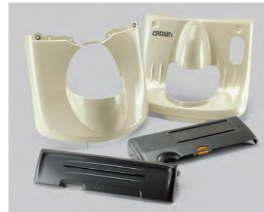
Duurzame stalen afdekpanelen

Neem geen genoegen met wegwerpdesign. Crown houdt rekening met de eisen van de toepassing, zodat u een duurzame en betrouwbare pallettruck krijgt. Zo gebruiken wij bijvoorbeeld stalen afdekplaten, omdat kunststof panelen hoge vervangingskosten met zich mee kunnen brengen.