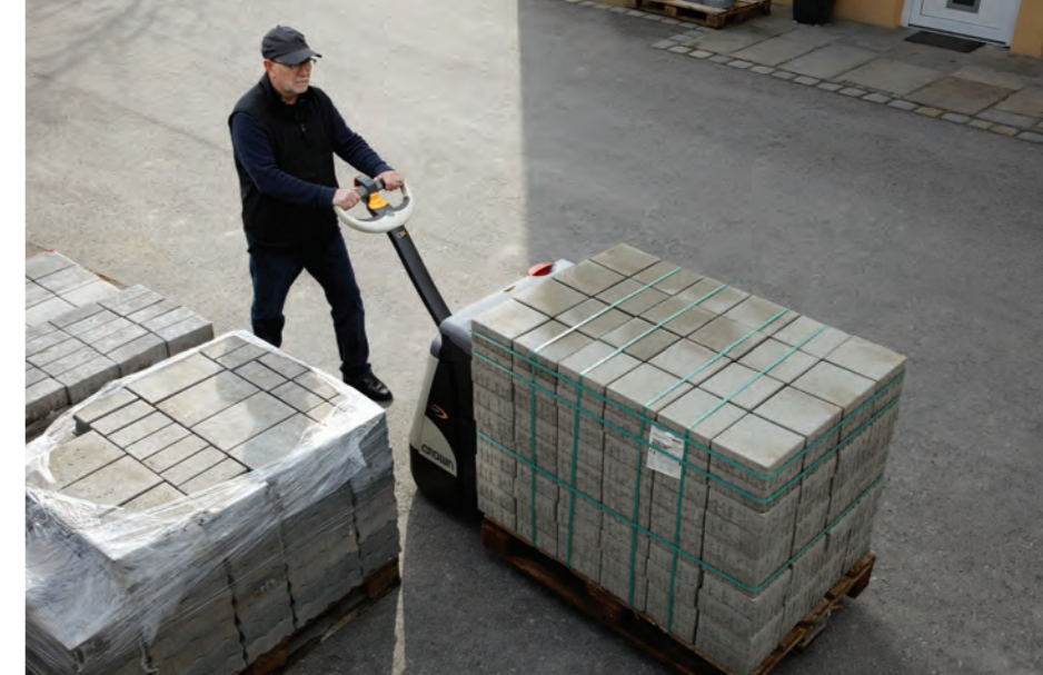
Transport van zware lasten

Ook de aandrijfcomponenten van de WP 3000-serie blinken uit in betrouwbaarheid en prestaties. De zwaar uitgevoerde versnellingsbak met robuuste schroeftandwielen zorgt voor soepele, krachtige en stille rijeigenschappen en een probleemloze inzet. Bepaalde modellen zijn speciaal ontworpen voor frequent gebruik in zware toepassingen. Deze zijn uitgerust met dubbele hardverchromde hefcylinders en een torsiestang om de stabiliteit van de lading te verbeteren.