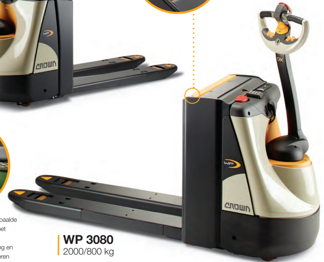
WP 3080 2000/800 kg

De trekstangen (alleen op bepaalde modellen) plaatsen de as van het hefmechanisme op het hoogst mogelijke punt om beschadiging en slijtage bij werken op ruwe vloeren uit te sluiten.