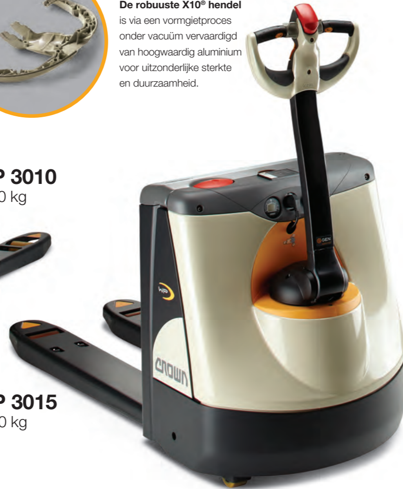
WP 3015 1600 kg