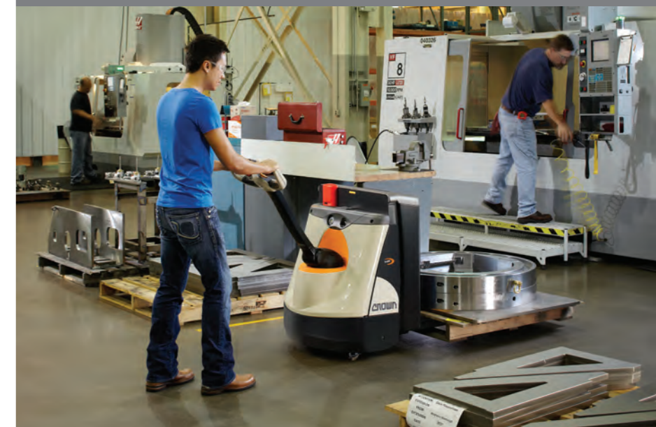
Inzet in de productie

De WP 3020 heeft een hefvermogen van 2000 kg. Dit in combinatie met zijn solide constructie en vlotte bediening maken de pallettruck ideaal voor het transport van zware lasten.