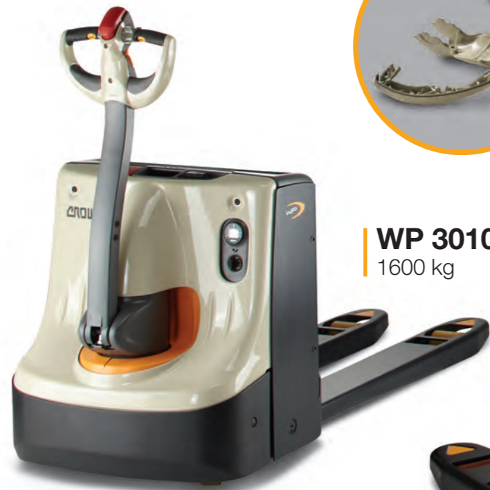
WP 3010 1600 kg

De robuuste X10® hendel is via een vormgietproces onder vacuüm vervaardigd van hoogwaardig aluminium voor uitzonderlijke sterkte en duurzaamheid.