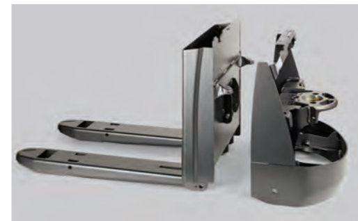
Geoptimaliseerde stalen chassis- en vorkconstructie

U krijgt 5 jaar garantie op onze geoptimaliseerde stalen chassis- en vorkconstructie. Pallettrucks die over ruwe vloeren en oprijplaten rijden, staan voortdurend bloot aan schokken. Daarom gebruiken we versterkte, eendelige vorken van hoogwaardig staal met verstelbare trekstangen.