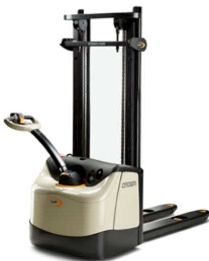
WF 3200-serie 1000 – 1200 kg