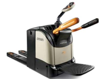
Série WT 3000 Transpaleteira com plataforma Capacidade de carga: 2.494 kg Plataforma: dobrável ou fixa