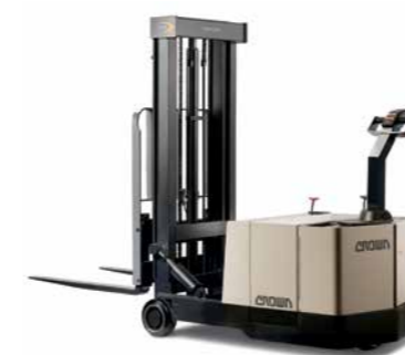
Série WB Empilhadeira patolada Walkie para trabalhos de nível intermediário Capacidade de carga: 900, 1.300 e 1.800 kg Altura de elevação: 2.692 a 4.521 mm