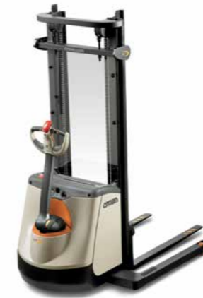
Série ST 3000 Empilhadeira patolada Walkie Capacidade de carga: 1.000 kg Altura de elevação: 2.400 a 4.250 mm