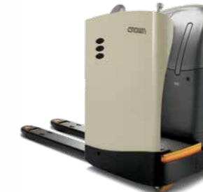
Série RT 4000 Transpaleteira com operador embarcado Capacidade de carga: 2.000 kg Garfos: comprimento duplo disponível