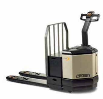
Série PW 3500 Transpaleteira Walkie Capacidade de carga: 2.721 e 3.628 kg