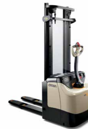
Série ES 4000 Garfo sobre patola Capacidade de carga: 1.500 kg Altura de elevação: 2.438 a 5.384 mm