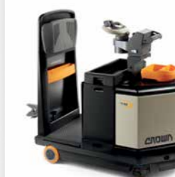
Série TR 4500 Rebocador Capacidade de carga rolante: 4.500 kg

A tecnologia inovadora e a construção para trabalhos pesados são os pilares dos rebocadores Crown, oferecendo potência e controle de tração testados e aprovados, para aplicações de fabricação, armazéns e centros de distribuição.