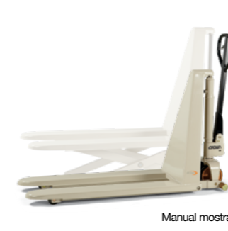
Elevação pantográfica manual PTH 50S Elevação pantográfica elétrica PTH 50PS Paleteira manual Capacidade de carga: 1.000 kg Altura de elevação: 800 mm