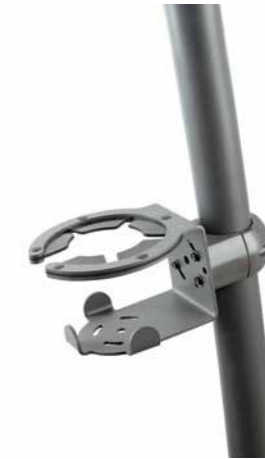
Suportes para copos