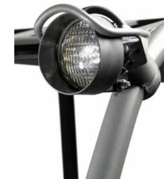
Luzes de trabalho