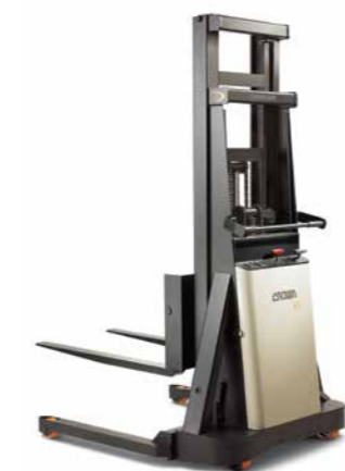
Série B Empilhadeira patolada Walkie para trabalhos de nível intermediário Capacidade de carga: 900 kg Altura de elevação: 1.371 a 2.794 mm