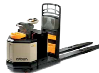
Série PC 4500 Transpaleteira com controle central Capacidade de carga: 2.700 a 3.600 kg Garfos: comprimentos duplos e triplos disponíveis

Disponível com: • Sistema QuickPick Remote