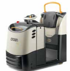
Série TC 3000 Rebocador Capacidade de carga: 3.000 kg