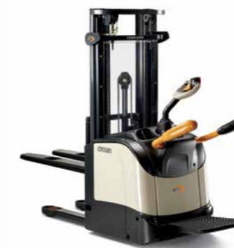
Série ET 4000 Garfo sobre patola Capacidade de carga: 1.500 kg Altura de elevação: 2.438 a 5.384 mm