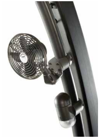
Ventiladores e luzes