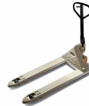
Série PTH 50 Paleteira manual Capacidade de carga: 2.300 kg