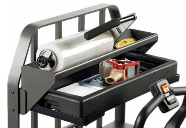
Bandejas de armazenamento e de filme stretch