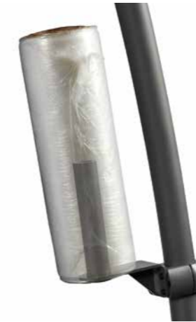
Suportes verticais para filme stretch