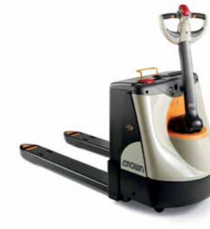
Série WP 3000 Transpaleteira Walkie Capacidade de carga: 2.000 kg