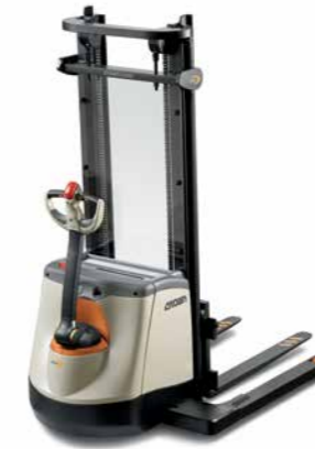
Série SX 3000 Empilhadeira patolada Walkie Capacidade de carga: 1.500 kg Altura de elevação: 2.400 a 4.250 mm