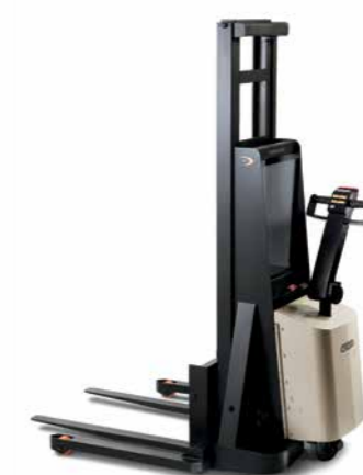
Série M Empilhadeira patolada Walkie para trabalhos de nível intermediário Capacidade de carga: 900 kg Altura de elevação: 1.701 a 3.302 mm