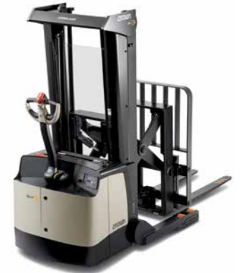
Série SHR 5500 Empilhadeira retrátil Walkie para trabalhos pesados Capacidade de carga: 113 a 1.600 kg Altura de elevação: 3.240 a 4.880 mm