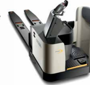
Série PR 4500 Transpaleteira com operador embarcado Capacidade de carga: 2.721 e 3.628 kg Garfos: comprimentos duplos e triplos disponíveis