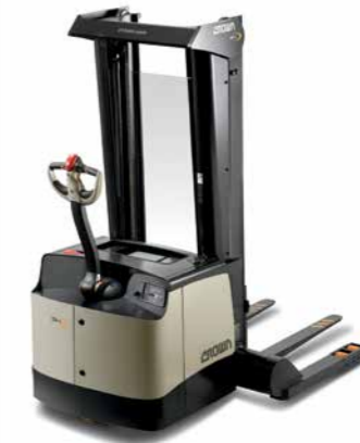
Série SH 5500 Empilhadeira patolada Walkie para trabalhos pesados Capacidade de carga: 1.800 kg Altura de elevação: 3.240 a 4.880 mm