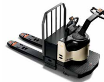
Série PE 4000/4500 Transpaleteira com operador embarcado Capacidade de carga: 2.700 a 3.600 kg Garfos: comprimentos duplos e triplos disponíveis Direção assistida disponível