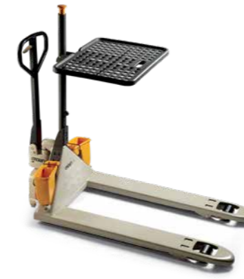
Bandeja de carga e bandejas de armazenamento da PTH