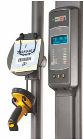
Pranchetas/ganchos para scanner