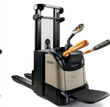
Série DT 3000 Empilhadeira patolada dupla Capacidade de carga: 1.500 kg Altura de elevação: 1.651 a 2.590 mm